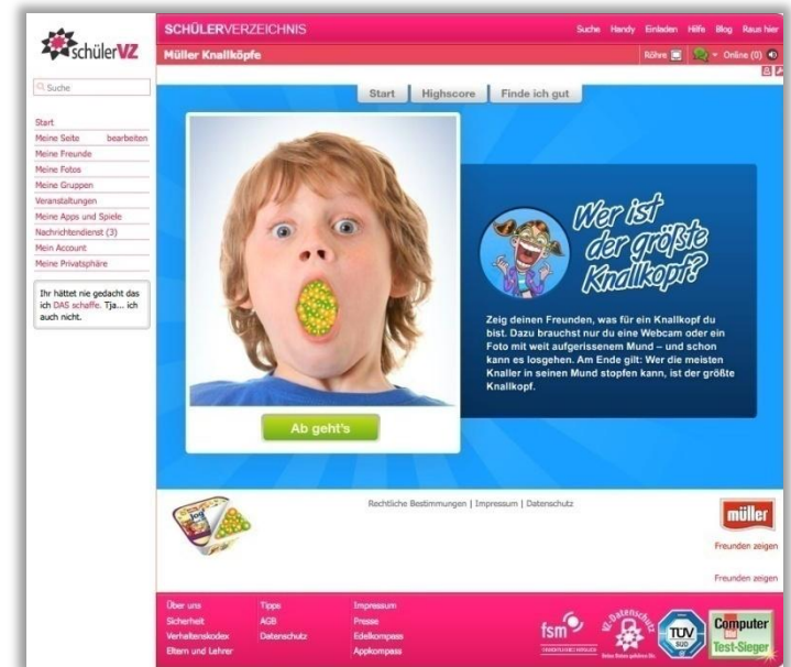
Müllers Edelprofil zur Kampagne "Knallköpfe"

Im Highscore kann man sehen, wie man innerhalb der Community abschneidet und wo sich die eigenen Knallkopffreunde befinden.