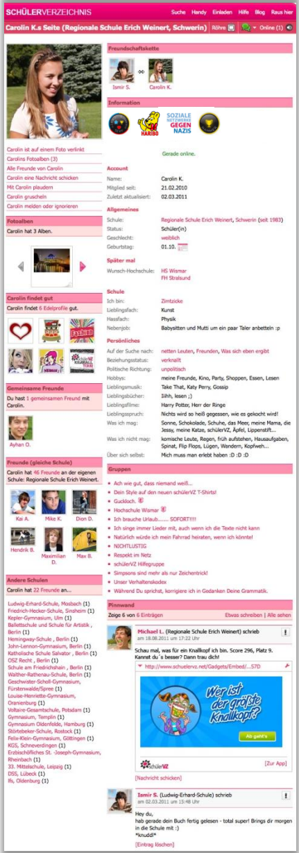
Nutzerprofil mit App-Post auf der Pinnwand