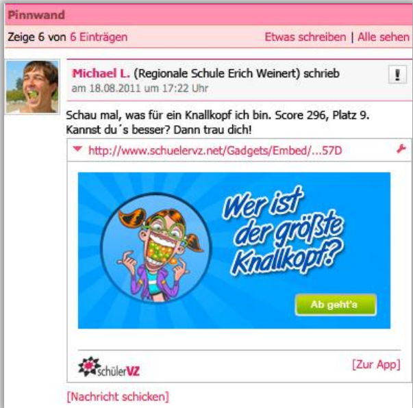
App-Post auf der Pinnwand

Um den Challenge-Charakter zu fördern, wird in diesem App-Post der eigene Punkte- und Highscorestand angezeigt.