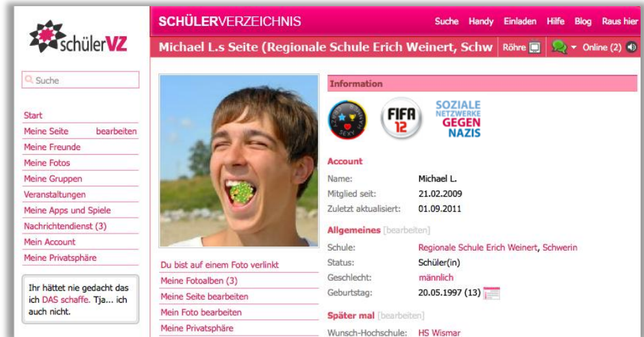
Nutzerprofil mit Knallkopf-Profilbild